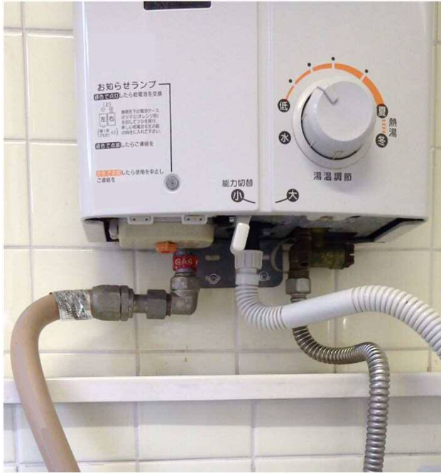
強化ガスホース (TU) +L型金具