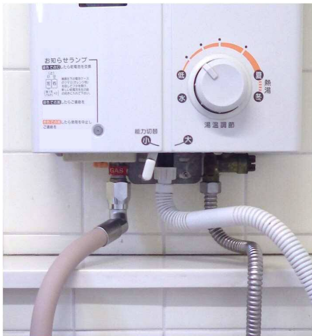
強化ガスホース (Rc) (SL自在型)