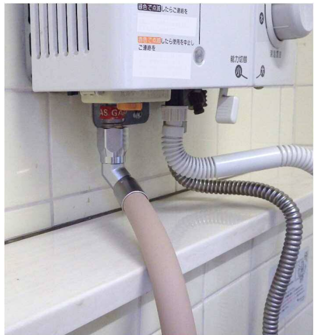
強化ガスホース (Rc) (SL自在型)